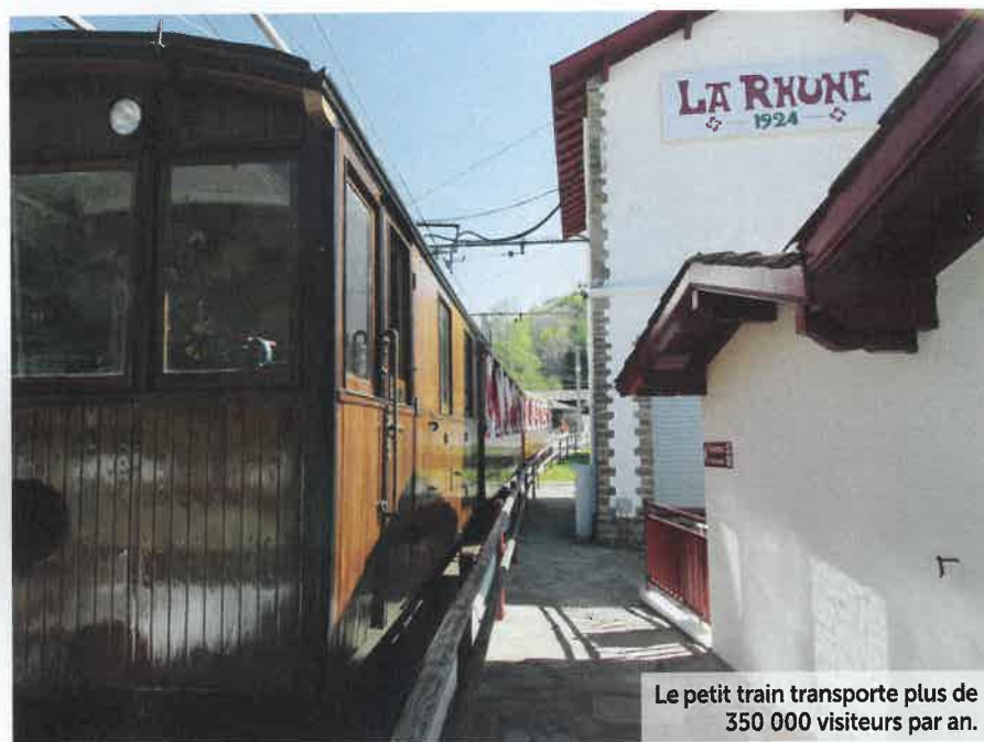
Le petit train transporte plus de 350 000 visiteurs par an.

pas à hier. La première personnalité à avoir réalisé l'ascension, en 1859, fut l'impératrice Eugénie (un obélisque de granit est élevé au sommet pour commémorer cet événement).