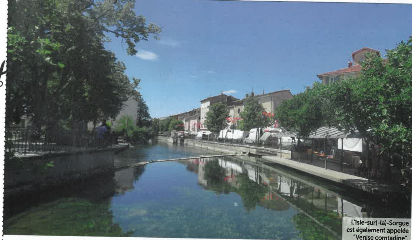
L'Isle-sur(-la)-Sorgue est également appelée "Venise comtadine".